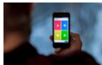
↑ I første kvartal ble det gjennomført 218 millioner Kahoot-spill.

resultatene i første kvartal i en oppdatering i begynnelsen av april, men selve rapporten ble offentliggjort torsdag.